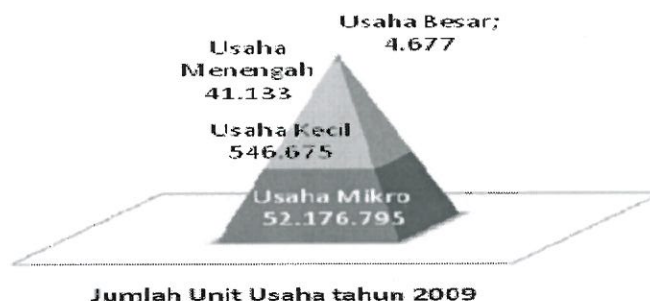
Gambar 5.1. Jumlah Unit Usaha Tahun 2009

Jumlah unit usaha mikro, kecil, dan menengah sangat mendominasi jenis usaha yang ada di Indonesia. Menurut data tahun 2009, dari total unit usaha yang ada, yaitu sebanyak 52.769.280 unit, yang tergolong UMKM mencapai 52.764.603 unit. Angka tersebut merepresentasikan 99,99 persen dari unit usaha yang ada. Jika digunakan Undang-undang No 20 tahun 2008 tentang UMKM, maka data tersebut mengindikasikan mayoritas nilai aset bersih unit usaha di Indonesia berada dibawah Rp.10.000.000.000,00 atau beromzet di bawah Rp.50.000.000.000,00 dalam satu tahun (Gambar 5.1).